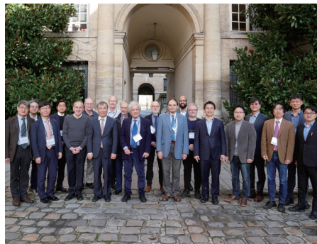
주요 선진한림원과의 공동심포지엄 개최