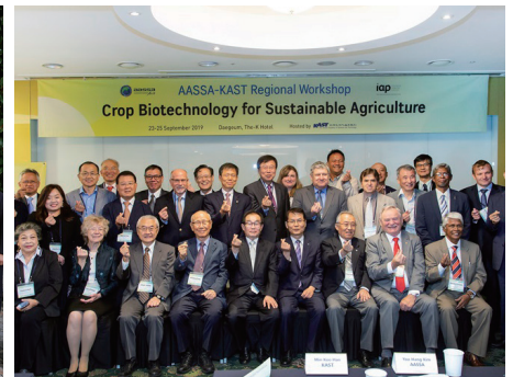
아시아과학한림원연합회(AASSA) 사무국 운영