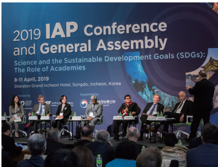
국제과학기술기구 운영 참여 및 국제심포지엄 개최

한국과학기술한림원은 전 세계 37개국 49개 학술기관과 협력관계를 맺고 과학기술 민간외교에 앞장서고 있습니다. 국제과학기술기구 및 해외아카데미와의 공조를 강화하고, IAP for Science 이사국 활동 및 아시아과학한림원연합회(AASSA) 사무국 운영 등을 통해 한국 과학기술의 위상을 드높이며, 한국 과학기술의 세계화를 도모합니다.