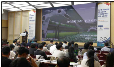
▲ (재)스마트팜연구개발사업단 공동 심포지엄 (2022.11.03)