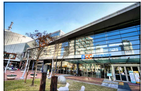
▲ 대전컨벤션센터(DCC) 전경