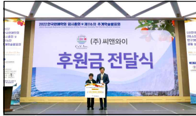
▲ 후원금 전달식(2022.11.04)