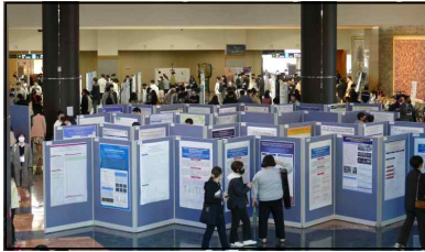
▲ 포스터 발표(2022.11.03~04)