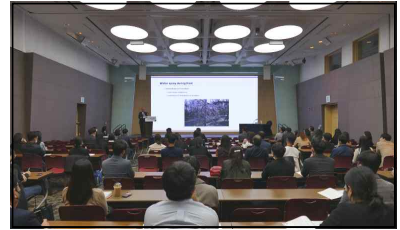
▲ 분과별 발표(2022.11.03~04)