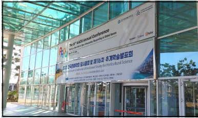
▲ 행사장 전경(2022.11.02~05)