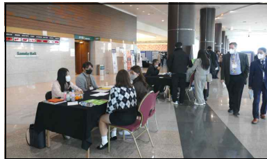
▲ 취업 상담 부스(2022.11.03)