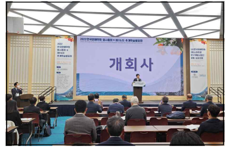
▲ 2022 임시총회(2022.11.03)